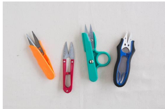
กรรไกรตัดเศษด้าย