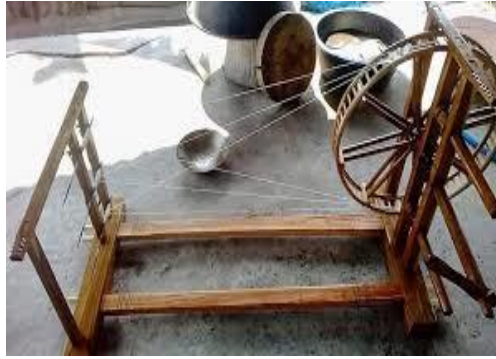
หลาปั่นไหม