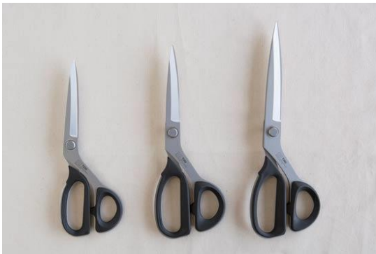
กรรไกรสำหรับงาน PATCHWORK

กรรไกรตัดผ้ามีปลายกรรไกรด้านหนึ่งเรียวแหลม และปลายกรรไกรอีกด้านโค้ง ทำจากเหล็กกล้าไร้สนิม ขัดเงาเรียบเป็นมันวาว มีขนาดยาวระหว่าง 20-30 เซนติเมตร ( 8 - 12 นิ้ว) เพื่อให้สะดวกในการใช้งานไม่ต้องขยับเลื่อนกรรไกรหลายครั้ง ซึ่งจะมีทั้งแบบด้ามตรงและด้ามโค้ง ซึ่งแบบด้ามโค้งจะช่วยให้การตัดผ้าเที่ยงตรง เพราะเวลาตัดจะขนานไปกับผ้า ส่วนแบบด้ามตรงจะเหมาะกับการตัดตะเข็บตอกแต่งหรือตัดชายกระโปรง ด้ามอาจทำด้วยโลหะเนื้อเดียวกับตัวกรรไกร หรือมีปลอกหุ้ม