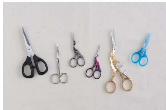
กรรไกรงานปักผ้า