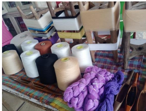
ด้ายไหมประดิษฐ์

ด้ายไหมประดิษฐ์ เป็นเส้นใยสังเคราะห์ที่มีคุณสมบัติเด่นคือมีความเหนียวเส้นเล็ก สีสดใส ชักแล้วสีไม่ตก เส้นใยทนทาน รีดเรียบได้ง่าย สามารถชักด้วยเครื่องชักผ้าได้ สีไม่ตกมีทั้งที่ย้อมสีสำเร็จรูป และราคาย่อมเยา