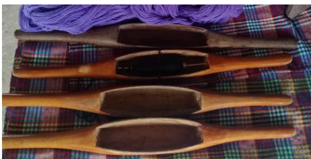
กระสวยทอผ้า

เป็นอุปกรณ์สำหรับใช้บรรจุหลอดด้ายเส้นพุ่งที่ใช้ในการทอผ้า มีหน้าที่ส่งด้ายพุ่งเข้าไปในด้ายเส้นยืนที่ซึ่งอยู่บนทูกทอผ้า ซึ่งหากเป็นกระสวยมือจะใช้มือพุ่งกระสวยกลับไปมาระหว่างเส้นยืนสลับกับการกระทุบฟืมเพื่อให้เนื้อผ้าแน่น แต่หากเป็นกระสวยสำหรับที่กระตุก กระสวยจะพุ่งกลับไปมาด้วยแรงกระแทกของการกระตุกจนกว่าจะได้เนื้อผ้าตามที่ต้องการ