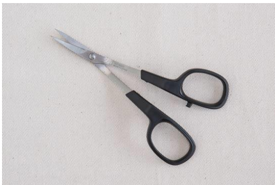
กรรไกรปลายโค้ง