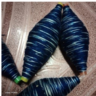
หลอดด้าย

ไม้เหยียบ ตะกอกทำจากไม้ไผ่หรือไม้สักขนาดกว้างประมาณ 2-3 นิ้ว ความยาวประมาณ 2-3 ฟุต สำหรับให้ผู้ทอเหยียบในขณะที่ทอเพื่อสลับเส้นฝ้ายไม้เหยียบนี้จะอยู่ด้านล่างของกี่เมื่อเหยียบไม้แล้วจะช่วยยกเส้นฝ้ายขึ้นลงเป็นลายขัดกัน จำนวนของไม้เหยียบจะขึ้นอยู่กับจำนวนเขาพิมพ์ที่กำหนดลวดลายที่จะทอ ซึ่งเรียกว่าลาย 2 ตะกอก ลาย 4 ตะกอก