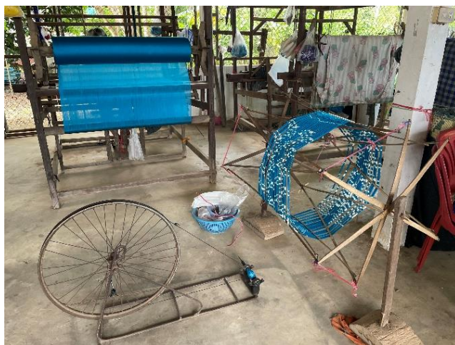
อัก ใช้พันเส้นด้าย เพื่อจัดระเบียบ