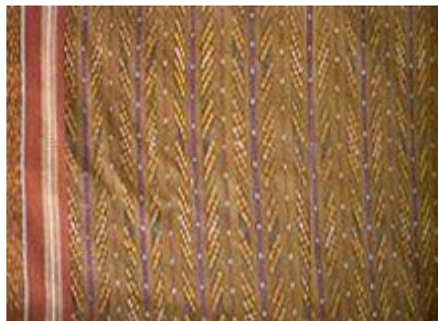
ลายต้นไผ่ ผ้าหมี่โฮล ลายต้นไผ่