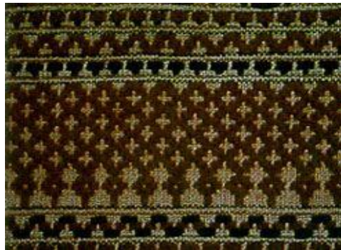
ผ้าชิตลายกากบาท