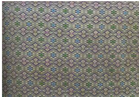
ตัวอย่างผ้าที่ทอเป็นลวดลายด้วยเทคนิคขิดเรียกว่า ผ้าขิด

ในปัจจุบันการทอผ้าพื้นบ้านพื้นเมืองหลายแห่งยังทอลวดลายสัญลักษณ์ดั้งเดิม โดยเฉพาะในชุมชนเชื้อสายชาติพันธุ์บางกลุ่มที่กระจายตัวกันอยู่ในภาคต่างๆ ของประเทศไทย ศิลปะการทอผ้าของกลุ่มชนเหล่านี้ จึงนับว่าเป็นเอกลักษณ์เฉพาะกลุ่มอยู่จนถึงทุกวันนี้ หากจะแบ่งผ้าพื้นเมืองของกลุ่มชนเหล่านี้ตามภาคต่างๆ เพื่อให้ เห็นภาพชัดเจนขึ้น ก็อาจจะแบ่งคร่าวๆ ได้ดังนี้