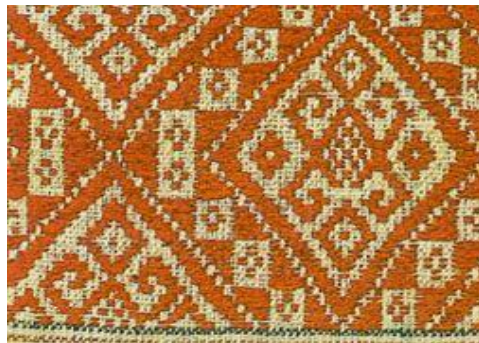
ผ้าชิตลายขนมเปียกปูน