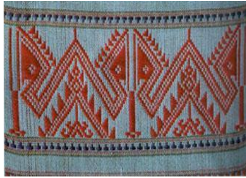
ลายนาคและปราสาท