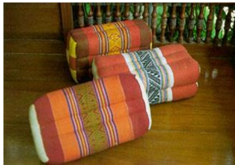
หมอนขิดลายพระอาทิตย์ ลายปราสาท ลายตากบ