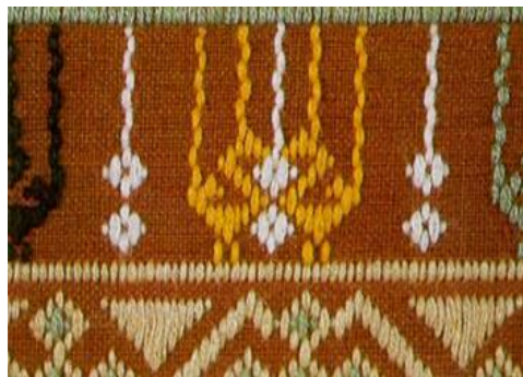
ผ้าชิตลายนกฮูก