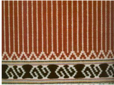
ลายเส้นตรง ลายซิกแซก ลายตะขอ