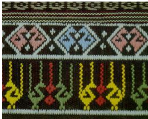
ผ้าตีนจก ลายกากบาท พระอาทิตย์ พระจันทร์ และนก