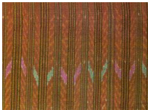
ผ้ามัดหมี่สุรินทร์

บางลวดลายก็เป็นคติร่วมกับความเชื่อ สากล และปรากฏอยู่ในศิลปะของหลายชาติ เช่น ลายขอ หรือลายกันหอย เป็นต้น ซึ่งนับว่าเป็นลายเก่าแก่แต่โบราณของหลายๆ ประเทศทั่วโลก หากเรารู้จักสังเกต และศึกษาเปรียบเทียบแล้ว ก็จะเข้าใจลวดลาย และสัญลักษณ์ในผ้าพื้นเมืองของไทยได้มากขึ้น และมองเห็นคุณค่าได้ลึกซึ้งขึ้น เพื่อง่ายต่อการทำความเข้าใจ เราอาจจะแบ่งลวดลายต่างๆ ได้ดังนี้