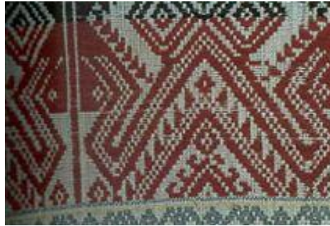
ลายพญานาคหรืองู และปราสาท ผ้าชิตลายนาคและปราสาท