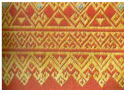
ลายพื้นปลา ผ้าลายตีนจก ลายพื้นปลา